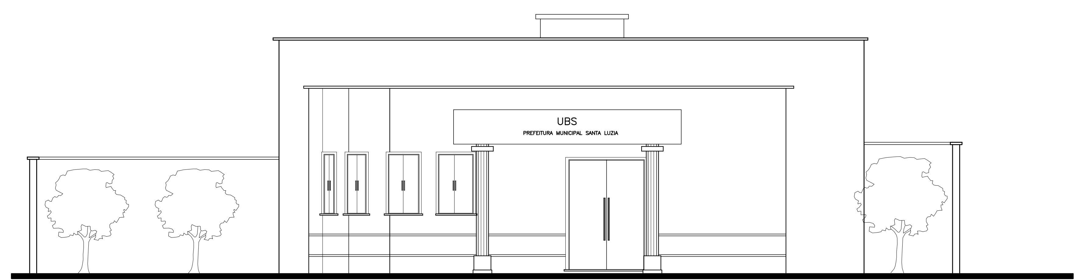
fachada principal escala 1/50